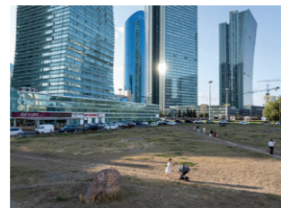
De wolkenkrabbers Northern Lights en Emerald Towers op de Nurzhol Boulevard, een drie kilometer lange showroom van monumentale starchitecture.

In 1997 werd de hoofdstad van Kazachstan verplaatst van het zuidelijke Almaty naar het meer centraal gelegen Astana. De nieuwe hoofdstad ontpopte zich tot de Global City van Centraal-Azië en zag het aantal inwoners toenemen tot meer dan een miljoen. De recente stedenbouwkundige metamorfose, gestoeld op prestige, nationalistische symboliek en architecturale extravaganza, moest het Kazachse volk een nieuwe identiteit geven na de val van de Sovjetunie. In plaats daarvan werd Astana een speeltuin voor architecten en projectontwikkelaars, die onvermijdelijk doet denken aan Dubai.