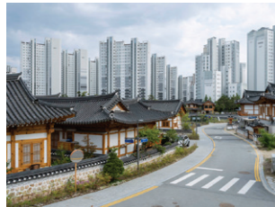
Hanok Village, een nieuwe residentiële wijk met luxe huizen in traditionele Koreaanse stijl.