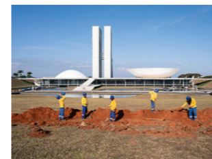
Nationaal Congres van Brazilië, ontworpen door Oscar Niemeyer.

BRASÍLIA, BRAZILIË, MEI 2022 Brasília, in slechts 41 maanden uit het niets opgebouwd, nam in 1960 de status van hoofdstad over van Rio de Janeiro. De utopische modelstad moest het symbool worden van een moderne natie en het binnenland van Brazilië economisch ontwikkelen. De stad is rationeel verdeeld in commerciële, residentiële en overheidssectoren. Hotels, banken en ambassades hebben ook hun eigen wijken. Met de auto als maatstaf werden brede boulevards en grote parkeergarages aangelegd. De bevolking van de stad groeide van 140.000 in 1960 tot 3 miljoen vandaag. Brasília's utopie leidde uiteindelijk tot een gesegregerde samenleving, met een welvend centrum voor een kleine groep uitverkorenen en onpersoonlijke buitenwijken voor de massa.