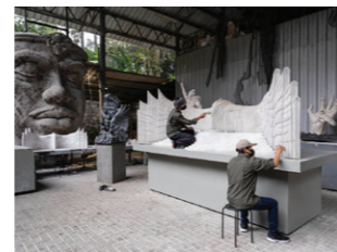
Schaalmodel van het presidentiële paleis, ontworpen door de Indonesische kunstenaar Nyoman Nuarta, in het NuArt Sculpture Park in Bandung. Het paleis stelt een Garuda-vogel met gespreide vleugels voor, een nationaal embleem van Indonesië.