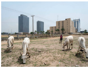
World Trade Center Abuja