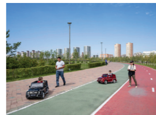
Botanische tuin van Astana.

Ter ere van Nursultan Nazarbaev, de eerste president van het onafhankelijke Kazachstan, kreeg Astana in maart 2019 de nieuwe naam Nur-Sultan. In september 2022 besloot huidig president Tokayev de oude naam in ere te herstellen, nadat er 227 doden vielen bij straatprotesten tegen corruptie.