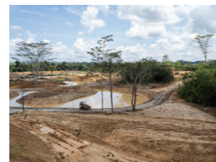
De bouwwerf van de Mentawir kwekerij, waar bomen zullen gekweekt worden om te herplanten in de nieuwe stad.