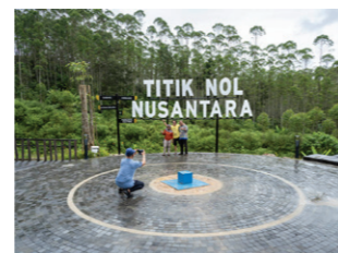
Een blauwe steen bij Titik Nol (Ground Zero) markeert het toekomstige geografische centrum van Nusantara, dat met 256.000 hectare 11 keer groter zal zijn dan het huidige Jakarta.

BRASÍLIA, BRAZILIË, MEI 2022 Brasília, in slechts 41 maanden uit het niets opgebouwd, nam in 1960 de status van hoofdstad over van Rio de Janeiro. De utopische modelstad moest het symbool worden van een moderne natie en het binnenland van Brazilië economisch ontwikkelen. De stad is rationeel verdeeld in commerciële, residentiële en overheidssectoren. Hotels, banken en ambassades hebben ook hun eigen wijken. Met de auto als maatstaf werden brede boulevards en grote parkeergarages aangelegd. De bevolking van de stad groeide van 140.000 in 1960 tot 3 miljoen vandaag. Brasília's utopie leidde uiteindelijk tot een gesegregerde samenleving, met een welvend centrum voor een kleine groep uitverkorenen en onpersoonlijke buitenwijken voor de massa.