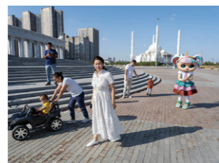
Het Onafhankelijkheidsplein met de Hazrat Sultan-moskee.