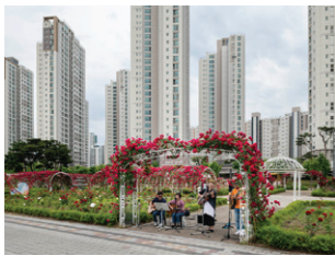
Sejong Supbaram rozentuin, Zuid-Korea, mei 2023