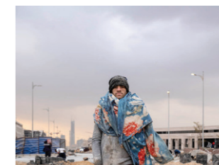
Arbeider in de overheidswijk.