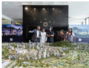
Schaalmodel van Centenary City, een geplande, ommuurde stad-in-de-stad naar het model van Dubai. Het zal een Vrije Economische Zone worden met de hoogste toren van Afrika, een gigantisch winkelcentrum, een vijfsterrenhotel, een stedelijk safaripark, een pretpark, luxe villa's en een ambassadewijk.