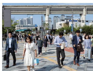
Ochtendspits nabij het Government Complex, een complex van 15 overheidsgebouwen die verbonden zijn door voetgangersbruggen.