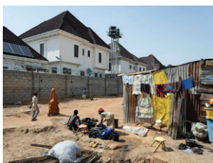
Sloppenwijk naast het ommuurde MAB Global Estate in het Gwarinpa district. Wie het zich kan permitteren woont, omwille van het veiligheidsprobleem, in een van de vele luxueuze estates. Dit zijn private, residentiële woonwijken die met muren, scheermesdraad en bemande checkpoints afgesloten worden van de chaos van de buitenwereld.

ABUJA NIGERIA, APRIL 2023 Met 200 miljoen inwoners is Nigeria het meest dichtbevolkte land van Afrika. Ongeveer 10% van hen wonen in de vroegere hoofdstad Lagos. Om die te ontlasten werd in de jaren 1980 een nieuwe stad gebouwd in het midden van het land. Abuja, officieel ingewijd als hoofdstad in 1991, moest een toonaangevende en neutrale stad worden die de samenhang van het etnisch en religieus verdeelde land zou versterken en economische kansen zou verspreiden. Op haar beurt werd Abuja één van de snelst groeiende steden in de wereld, met nu bijna 4 miljoen inwoners én een enorme inkomstenkloof.