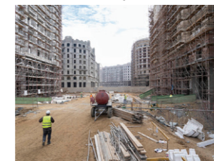
Vijfde Residentiële Wijk (R5). Mensen die hun intrek willen nemen in de nieuwe stad, hebben toestemming nodig van de overheid.