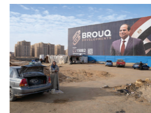
Een billboard van de Egyptische projectontwikkelaar Brouq Developments waarop President Abdel Fattah el-Sisi afgebeeld staat.

NIJWE ADMINISTRATIEVE HOOFDSTAD, EGYPTE, JANUARI 2022 Als reactie op de overbevolking, vervuiling en verkeersopstoppingen in Caïro, wordt een gigantische nieuwe satellietstad gebouwd in de woestijn ten oosten van de huidige hoofdstad. De Nieuwe Administratieve Hoofdstad met een toekomstige bevolking van 6 miljoen inwoners maakt deel uit van President Al-Sisi's Egypt Vision 2030, een langetermijnplan om Egypte verder te ontwikkelen. Tegenstanders voorspellen een groeiende socio-economische kloof tussen de verarmde meerderheid en een elite van bevoorrechte burgers. De Nieuwe Administratieve Hoofdstad lijkt vooral een prestigieus politiek project dat gericht is op de uitbreiding van het machtsapparaat, overheidscontrole en internationaal leiderschap. Terwijl de staat zich ontpopt tot een machtige projectontwikkelaar, verstevigt het leger zijn greep op de samenleving.