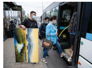
Bushalte in het centrum van Astana.