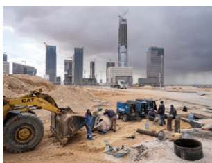
Central Business District, met de 394 meter hoge Iconische Toren in aanbouw. Nieuwe Administratieve Hoofdstad, Egypte, januari 2022

ABUJA NIGERIA, APRIL 2023 Met 200 miljoen inwoners is Nigeria het meest dichtbevolkte land van Afrika. Ongeveer 10% van hen wonen in de vroegere hoofdstad Lagos. Om die te ontlasten werd in de jaren 1980 een nieuwe stad gebouwd in het midden van het land. Abuja, officieel ingewijd als hoofdstad in 1991, moest een toonaangevende en neutrale stad worden die de samenhang van het etnisch en religieus verdeelde land zou versterken en economische kansen zou verspreiden. Op haar beurt werd Abuja één van de snelst groeiende steden in de wereld, met nu bijna 4 miljoen inwoners én een enorme inkomstenkloof.