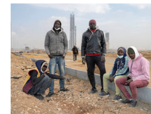
Zuid-Soedanese arbeiders voor de Iconische Toren.