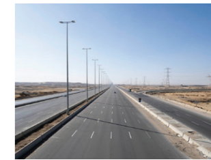
Een nieuwe regionale ringweg doorkruist de Nieuwe Administratieve Hoofdstad.