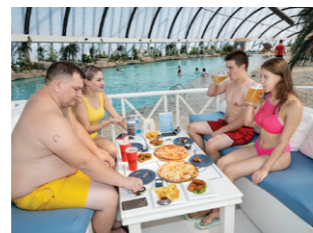
Sky Beach Club, een overdekte lagune in het winkel- en amusementscomplex Khan Shatyr.