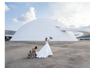
Honestino Guimarães Nationaal Museum, ontworpen door Oscar Niemeyer.