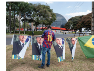
Banners met een afbeelding van de toenmalige president Jair Messias Bolsonaro.