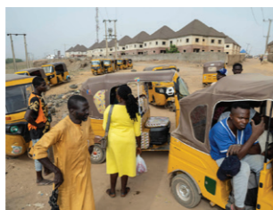
Standplaats van motortaxi's langs Airport Road.

NUSANTARA, INDONESIË, AUGUSTUS 2022 In 2019 kondigde president Widodo het plan aan om de Indonesische hoofdstad te verplaatsen van Jakarta, dat wordt geteisterd door overbevolking en overstromingen, naar een geplande nieuwe stad in Oost-Kalimantan, Borneo. De nieuwe hoofdstad Nusantara wordt voorgesteld als een groene smart city, met naar verwachting 2 miljoen inwoners tegen 2045. Critici waarschuwen echter voor de negatieve gevolgen van het megaproject voor de natuur, het milieu en de lokale gemeenschappen. Het geselecteerde gebied ligt aan de rand van een van de oudste regenwouden ter wereld. Bovendien