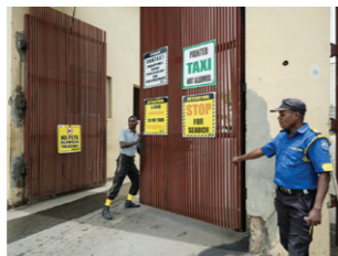
Beveiligde toegangspoort naar Brains & Hammers City Estate in het district Life Camp.